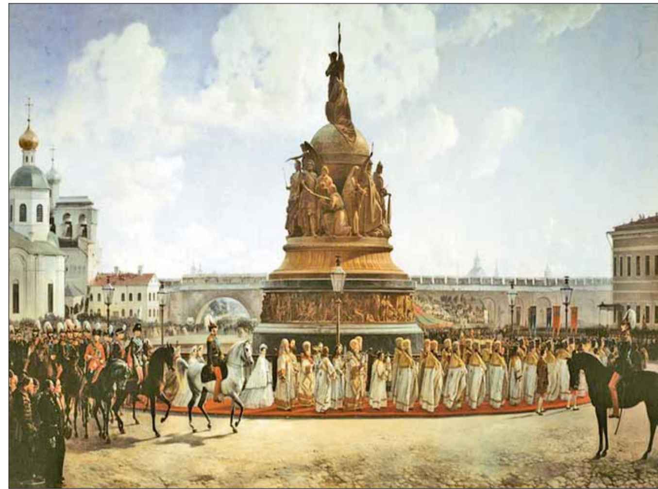
Богдан Виллевалде. «Открытие памятника «Тысячелетие России». 1864 г.

Но и русская интеллигенция, которая, как всегда, раскололась... Раскололась на тех, кто во всех грехах обвинял власть, и тех, кто готов был защищать власть в любых её проявлениях.